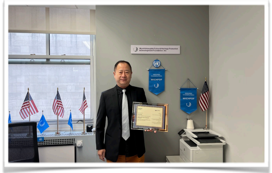
(右图为世界非遗基金会获得联合国教科文组织“活遗产与可持续发展”资质证书)

教科文组织、世界卫生组织、世界非遗基金组织在实施可持续发展中都宣传人类活遗产的重要性，人类活遗产，非物质文化遗产起源于联合国公约，世界非物质文化遗产保护与发展基金会倡导用人类活遗产项目促进良好健康生活方式，根除疾病，并公益提供解决方案。