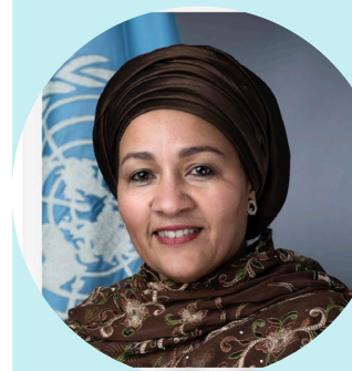
联合国常务副秘书长阿米娜·穆罕默德。可持续发展目标制定者。