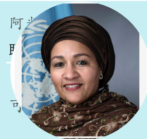
世界非物质文化遗产 保护与发展基金会