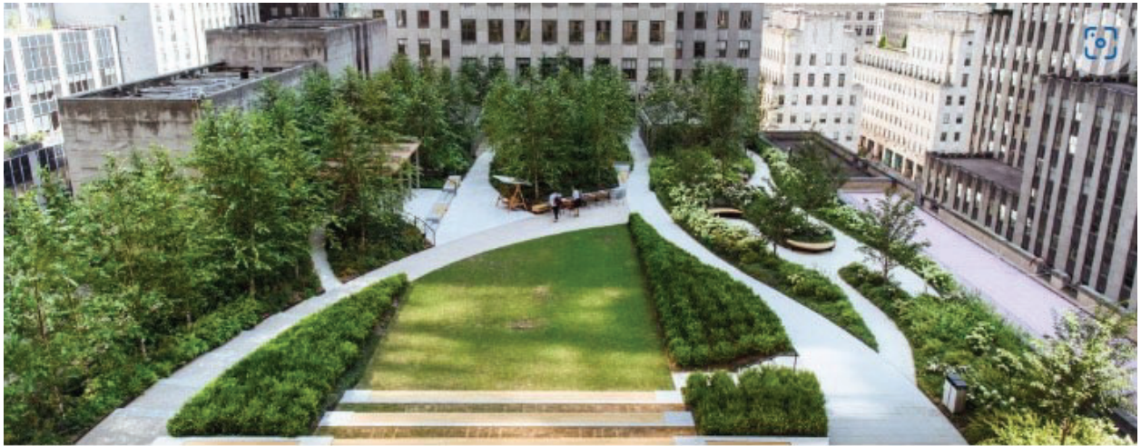
“命铺”高血压运动处方培训场所。1270 6th 洛克菲勒中心 10th Floor

二台的使用方法，每天把一台针灸设备横着放在地上，双脚放在设备里音波发声器上即可，可以移动，共振到双脚每个部位。每次使用一个小时，可多次使用。第二台竖着放在坐椅或沙发上，设备里有四个音波发声器，尾巴骨对着最后面的一个发声器即可，与脚下的设备同时使用。 美国生命波公司