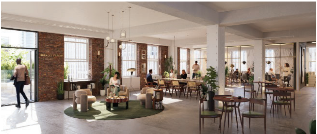
“命铺”冥想2.0场所（实景）1270 6th 洛克菲勒中心 10th Floor